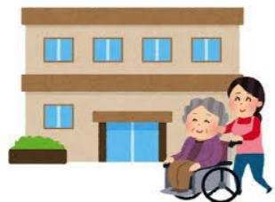
施設サービス(短期入所等)